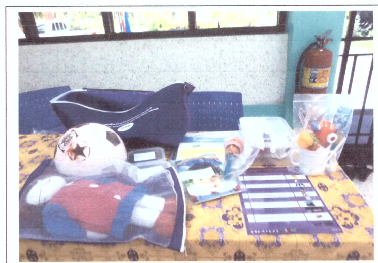
ชุดสาริตพัฒนาการเด็กตามกลุ่มอายุ