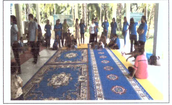
แข่งขันคลาน เดิน วิ่ง เด็ก0-2ปี