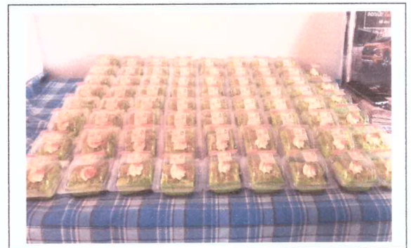
อาหารว่างและอาหารกลางวันผู้เข้าร่วมประชุม