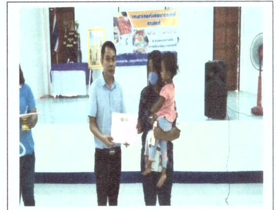
นายกอบต.ลำภีกกล่าวเปิดประชุม และมอบเกียรติบัตรให้แม่ที่เลี้ยงลูกด้วยนมแม่ครบ 6 เดือน