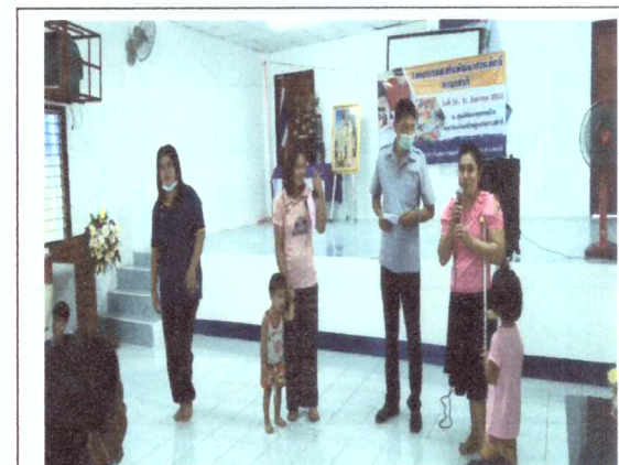
แลกเปลี่ยนเรียนรู้การเลี้ยงลูกด้วยนมแม่สำเร็จ