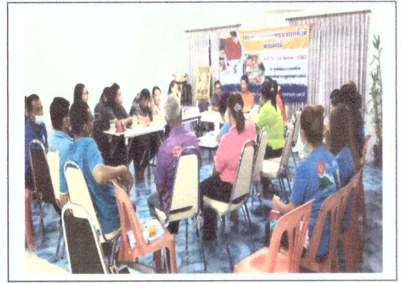
อบรมให้ความรู้ คณะทำงานและ อสม.แกนนำนมแม่