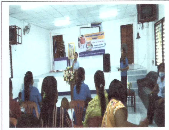
ประธานชมรมอสม.รพ.สต.บกปูยกกล่าวรายงาน