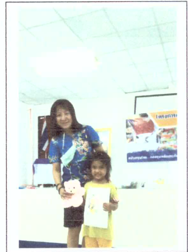
แข่งขันวาดภาพระบายสีเด็ก3-5