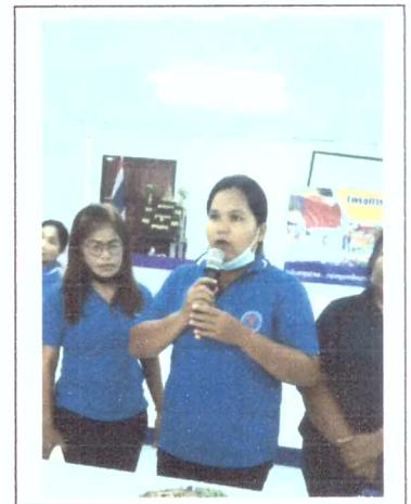
สอน สาธิต อาหารสำหรับหญิงตั้งครรภ์และหญิงให้นมบุตร