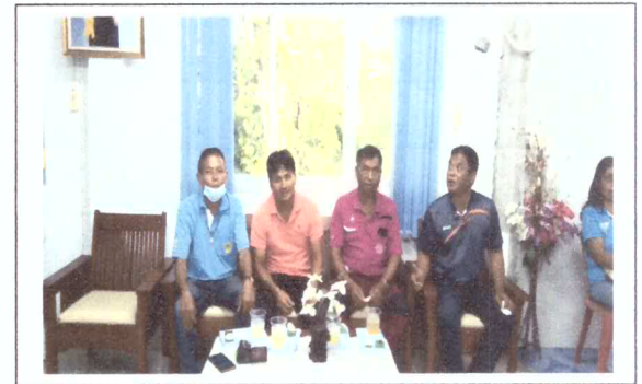
แต่งตั้งคณะกรรมการตำบลพัฒนาการเด็กดี เด็ก0-5ปีสูงดี สมส่วน พัฒนาการสมวัย ฟันไม่ผุ